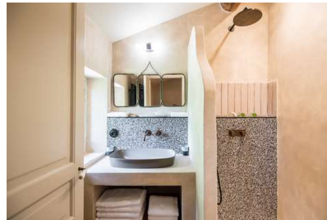
Le Pavillon du Levant